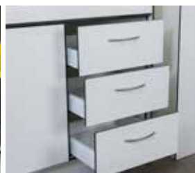
Unité à tiroirs (fond du tiroir en HPL)