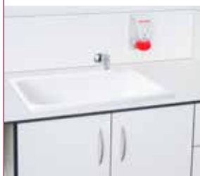
Unité avec baignoire intégrée