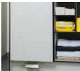
Unité à poubelle à commande au pied en inox