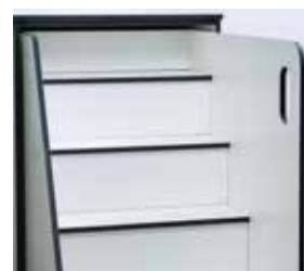
Unité à escalier d'accès coulissant